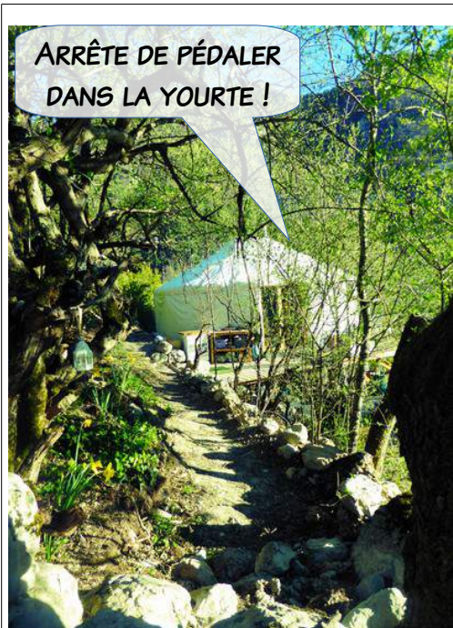
Illustration 1: Y EN A QUI PÉDALENT DANS LA YOURTE !

On constate qu'avec une résolution de 150DPI la taille passe de 33078 Kio à 122 Kio !